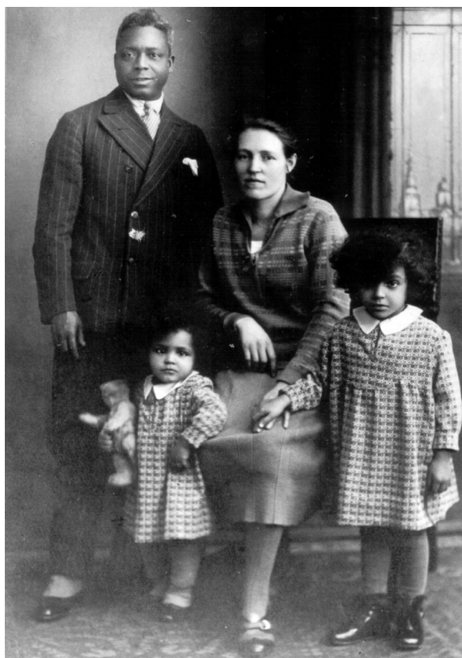
Die Browns, eine Bockenheimer Familie